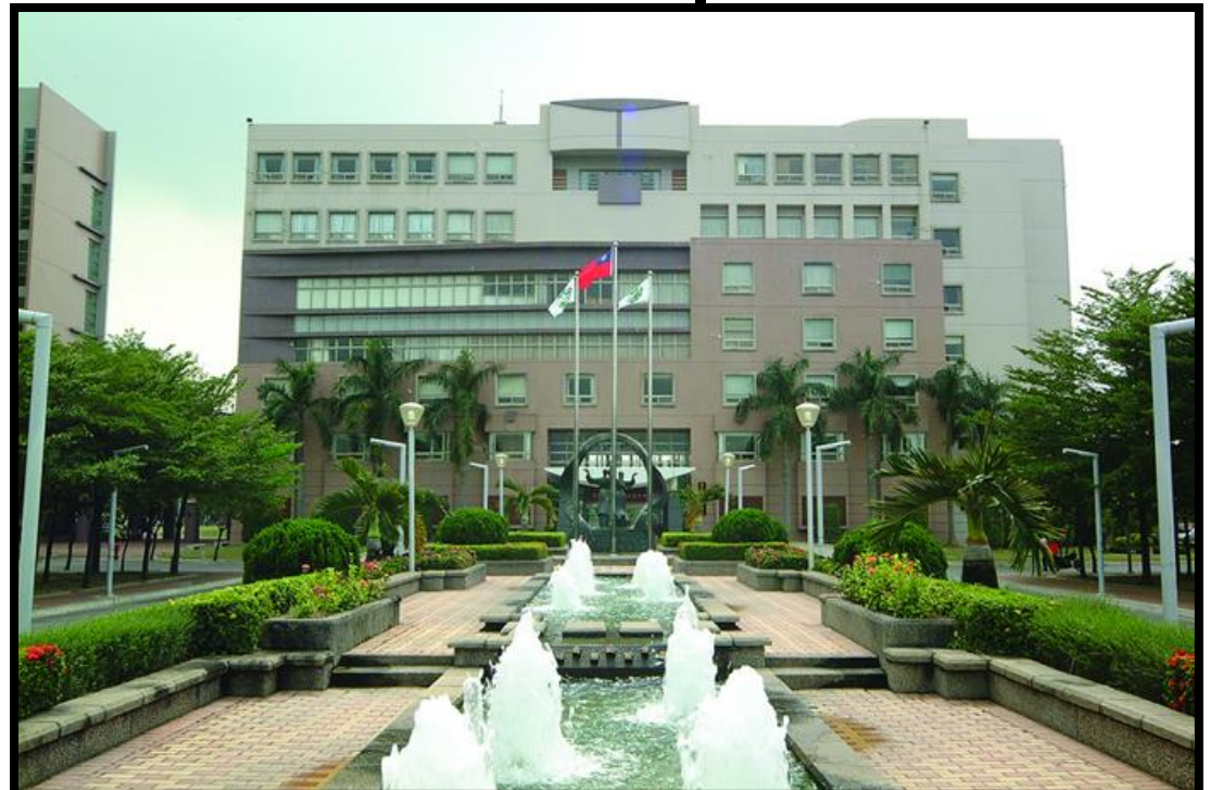
高餐校園正門口 Main Entrance