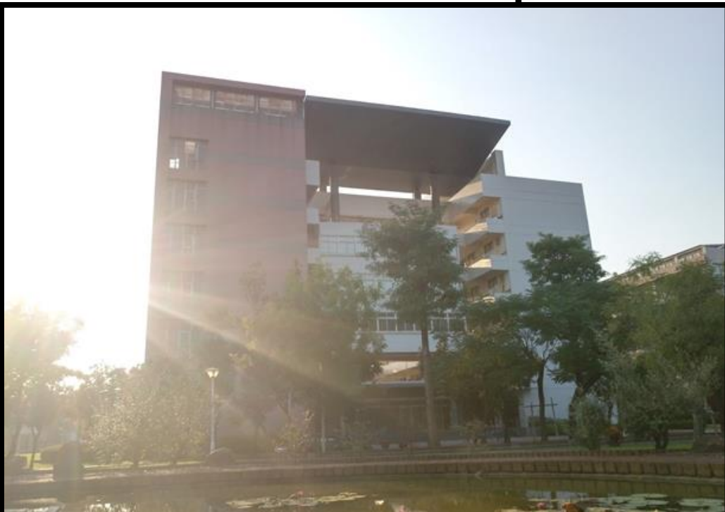
國際大樓外觀 Exterior Appearance of International Building